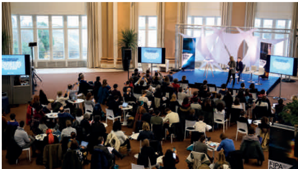
JOURNÉES PROFESSIONNELLES, FIPADOC 2019

Le FIPADOC a également noué des partenariats permettant des diffusions multiformes, de proximité comme de prestige.